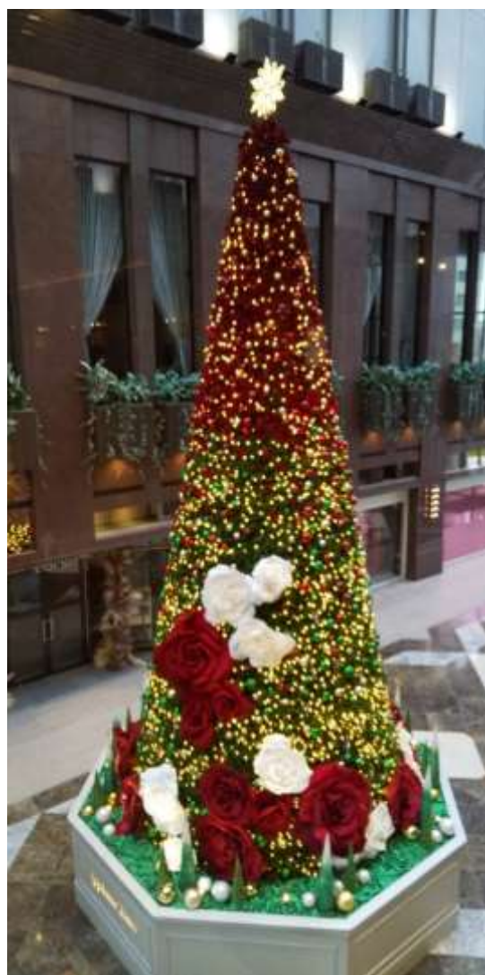
梅田界隈のクリスマスツリー

▶本ニュースに関するご照会・ご意見等は、全中貿事務局（大洋株式会社内）鹿内 までお願いします。