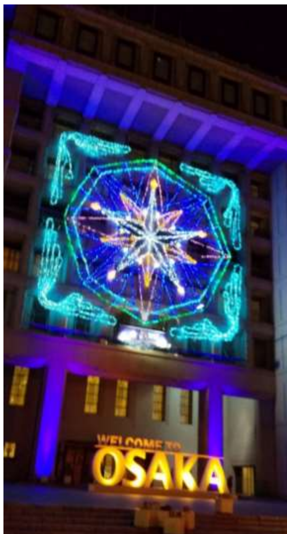
大阪市のイルミネーション